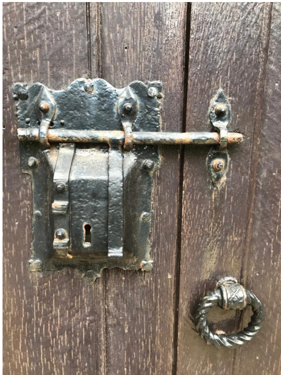
De zijdeur (kant kerkhof) van 'De Burght'